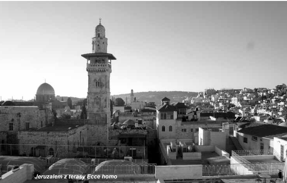
Jeruzalem z terasy Ecce homo