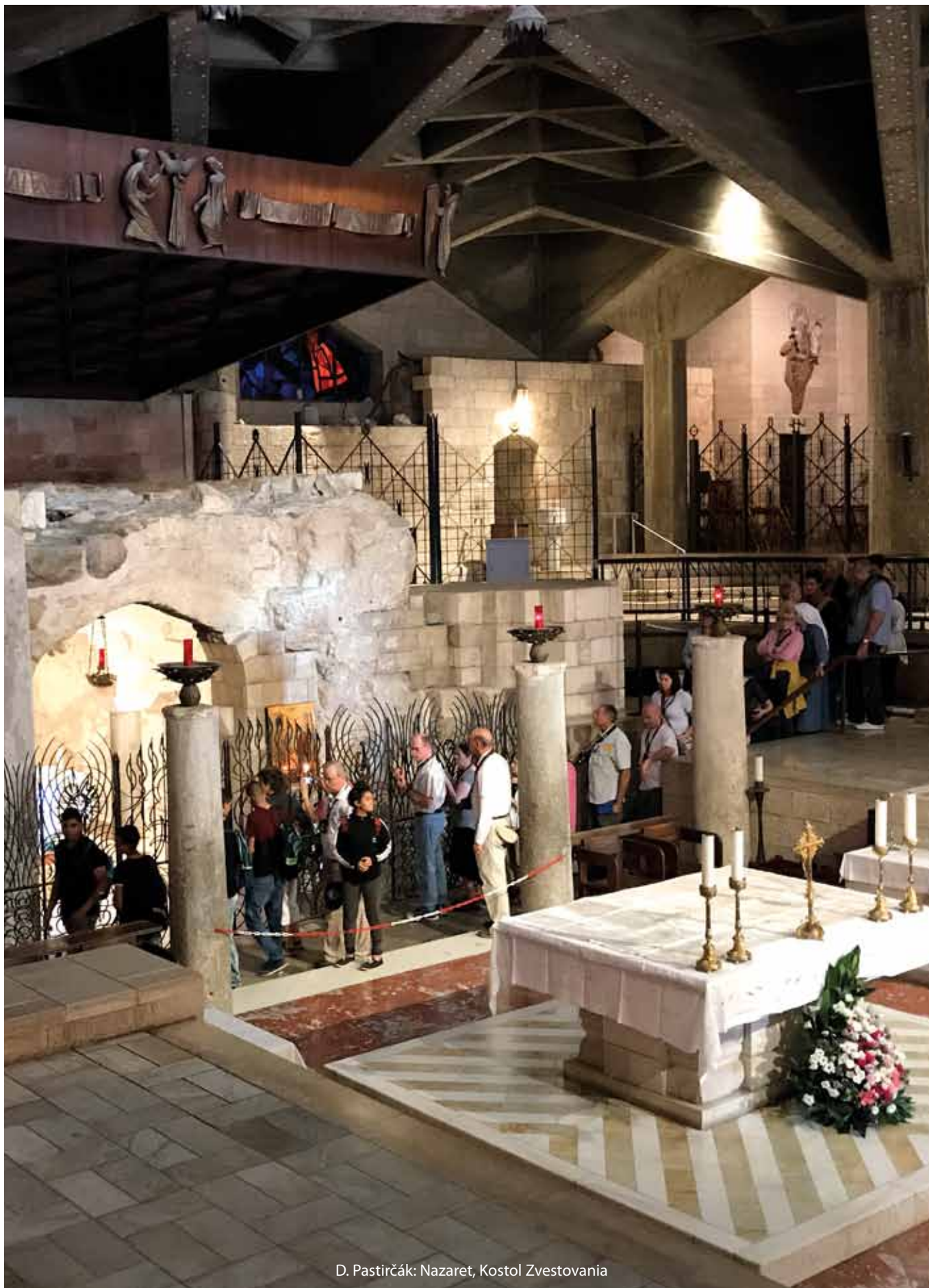
D. Pastirčák: Nazaret, Kostol Zvestovania