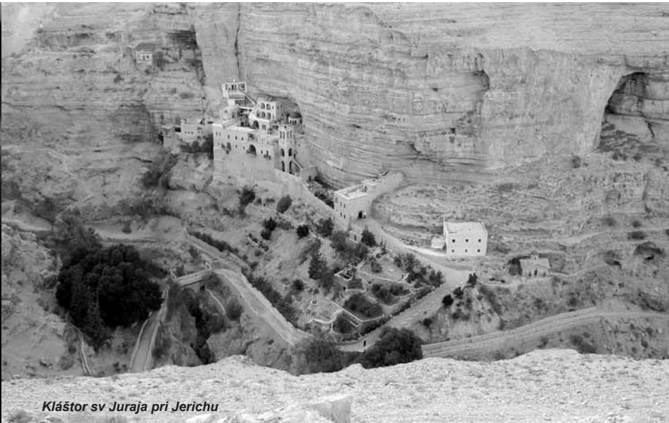
Kláštor sv Juraja pri Jerichu

druhým, že sa budú v mene toho istého Boha navzájom vraždiť.