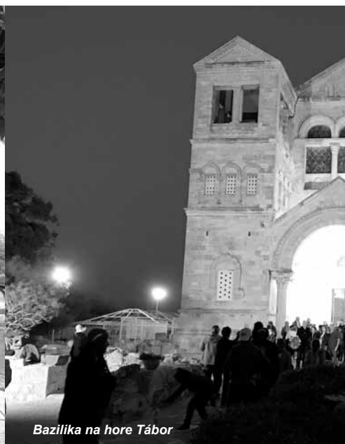
Bazilika na hore Tábor