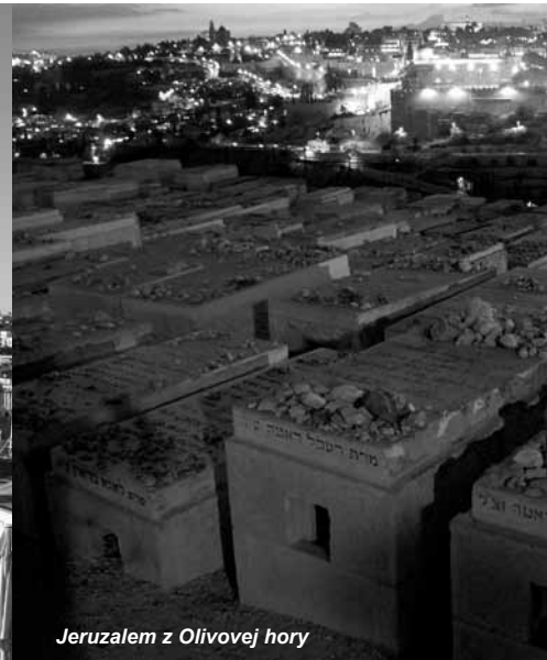
Jeruzalem z Olivovej hory

stavebné práce zväčša iniciovala matka byzantského cisára Konštantína Helena. V Jafe sme strávili deň, tri ďalšie dni sme boli v Jeruzaleme, a potom sme si prenajali autá a navštevovali sme ďalšie naplánované miesta. Prešli sme cez Jericho, ďalšiu noc sme strávili pri Genezaretskom jazere na okraji Tiberias; tu sme sa zdržali dva dni a ďalšie dve noci sme spali na hore Tábor. To bol tiež silný zážitok. Tábor je tá hora, kam Ježiš podľa evanjelia vezme svojich troch učeníkov a zjaví sa mu tu Mojžiš a Eliáš. Peter povie: Postavme si tu tri stany. Tie si síce nepostavili, ale o tisíc tristo rokov neskôr tam františkáni postavili baziliku, kláštor a dom pre pútnikov. Okrem takmer neviditeľných mníchov a pár mladých dobrovoľníkov sme tam boli iba my. Tiché miesto, plné mieru. Slávnostnú večeru nám livejovský dobrovoľník z Milána podával v rozľahlej kamennej sále. Dve noci na Táboře – to bola nádhera. Odtiaľ sme sa vybrali navštíviť niektoré z Biblie známe miesta do púšte. Zastavili sme sa v En Gedi, v oblasti Mŕtveho mora. K tomuto miestu sa viaže príbeh stretnutia Dávida a Saula. Saul už tuší, že Dávid je budúcim kráľom. Dávid sa so svojou tlupou skrýva hore v starých zrúcaninách nad prameňom En Gedi. Saul pritia-