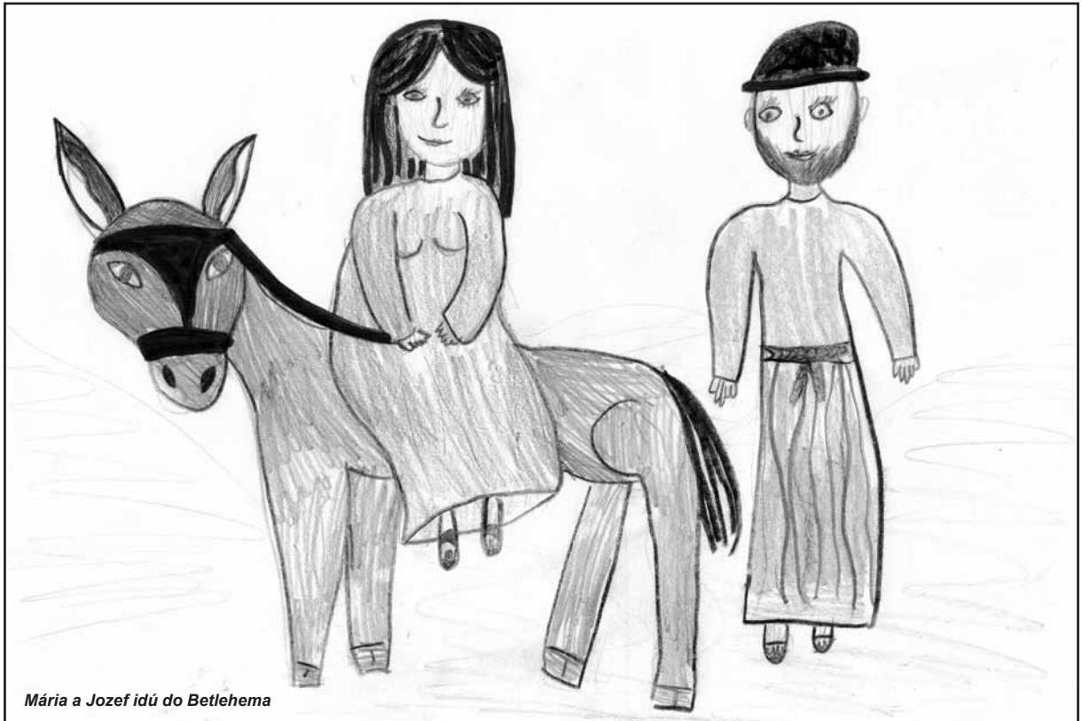
Mária a Jozef idú do Betlehema

Chudoba nie je nič atraktívne. Nechceme byť chudobní! Dokonca aj medzi kresťanmi je chudoba čoraz viac považovaná za slabosť, aj keď pre ranú cirkev bola cnosťou. Rozdávali a predávali, čo mali, v nádeji skorého návratu Pána Ježiša. A všetko považovali za spoločné. Ktovie prečo sme sa tak veľmi odklonili od podobných myšlienok?! Žeby sme prestali očakávať Krista? Mnoho kresťanov dnes vyznáva lákavú teológiu prosperity, ktorá hovorí o tom, že veriaci ľudia by mali byť bohatí, pretože to, čo máme alebo nemáme, súvisí s našou vierou. Že Hospodin požehnáva veriaceho vo všetkom. O čom samozrejme nepochybujem, ak správne rozumieme slovu „požehnanie“. Je to Božia blízkosť a Jeho konanie? Alebo sú to veci a to, čo máme, čo vlastnime? Neraz je toto myslenie iba pekným duchovným pozlátkom egoizmu, sebeckta a sústredovania sa na seba.